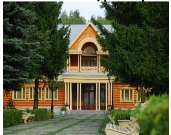
Кырлай мемориаль музей комплексы